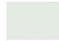
7047 telegrau4 B.1