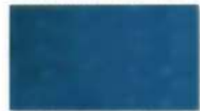
Decklack 5010 blau