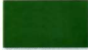
Decklack 6009 tannengrün