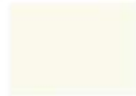
9001 cremeweiß B.1