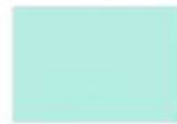
6027 lichtgrün B.1