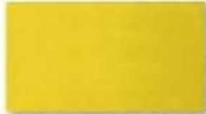
Decklack 1021 gelb