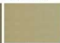
Estrichfarbe 130 beige