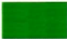
Decklack 6002 laubgrün