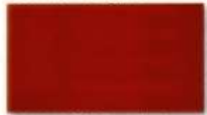
Decklack 3013 nordisch-rot