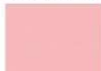
3015 hellrosa B.1