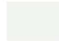
9002 grauweiß B.1

Beachten Sie die unterschiedlichen Farbwiedergaben je nach Medium. KEINE FARBGARANTIE. Keine Rücknahme! Rundum Natur Heeke Steinfurter Str. 9 48149 Münster 0251 200 7303 info@rundum-natur.de SHOP: www.leinos24.de