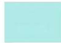
6034 pastelltürkis B.1