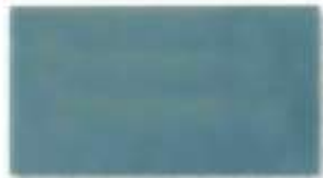
Decklack 5014 taubenblau