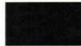
Decklack 9005 schwarz