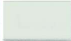
Decklack 7035 lichtgrau